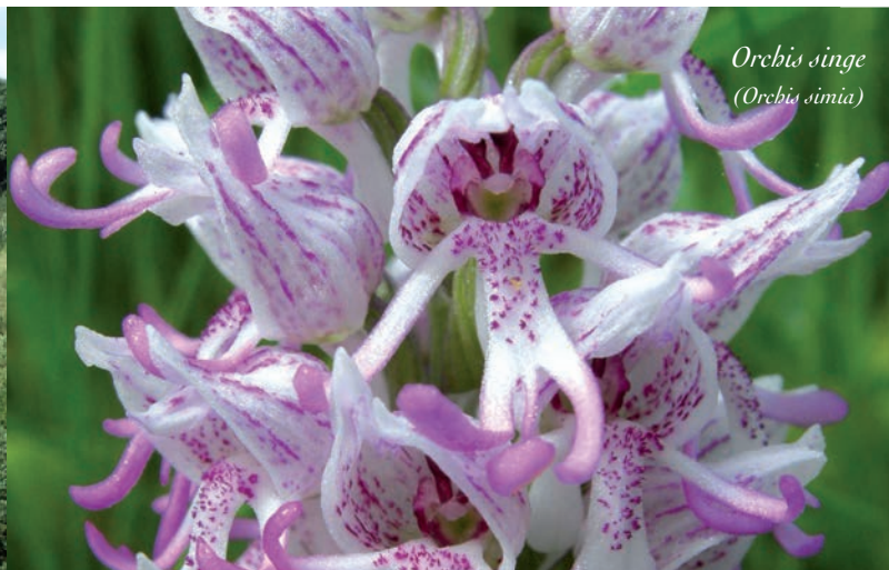
Orchis singe ( Orchis simia )