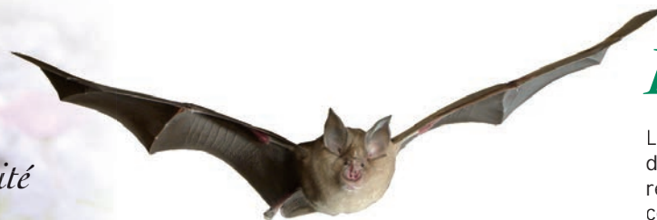
Grand Rhinolophe ( Rhinolophus ferrumequinum )