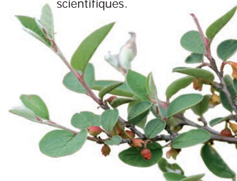
Cotonéaster sauvage ( Cotoneaster integerrimus )

Cette réserve nationale est gérée par l'Office National des Forêts et le Conservatoire du patrimoine naturel de Champagne-Ardenne. Pour être efficacement gérés, les milieux naturels doivent faire l'objet d'une connaissance approfondie. Les co-gestionnaires sont donc chargés de concevoir et d'appliquer un plan de gestion. Ce document définit les travaux de gestion à mettre en œuvre (débroussaillage des pelouses, remise en pâturage...) ainsi que les suivis et évaluations scientifiques.