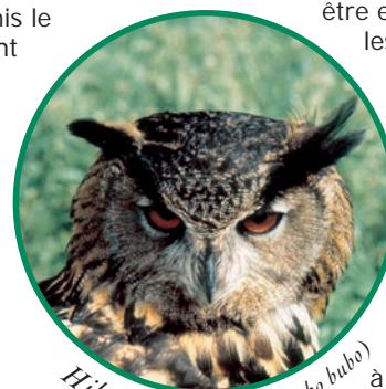
Hibou grand duc ( Bubo bubo )

En effet, 454 espèces végétales ont été recensées. Citons par exemple, le cotonéaster sauvage, l'armoise blanche, le pied de chat et l'orchis singe, espèces emblématiques des zones rocheuses et des pelouses sèches du secteur.