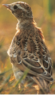
Alouette lulu ( Lulula arborea )