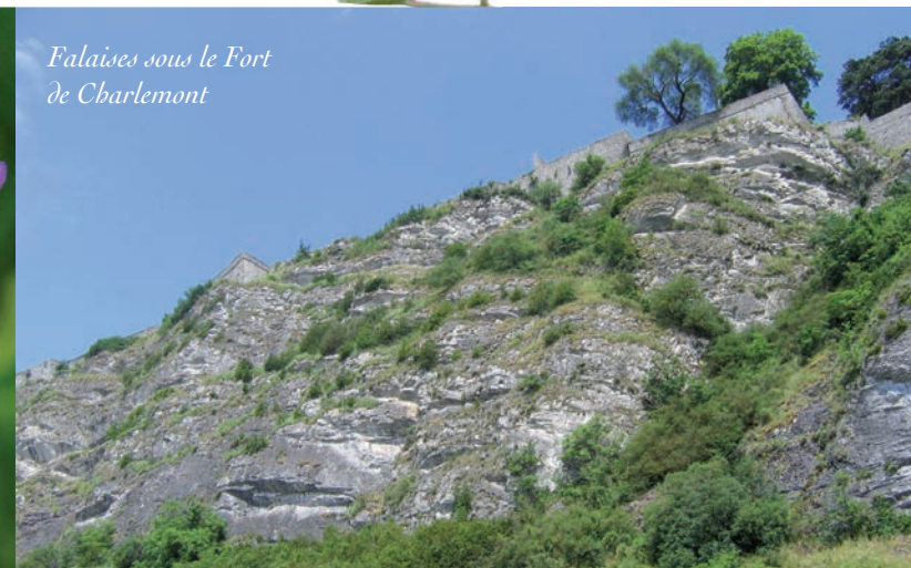
Falaises sous le Fort de Charlemont

Une diversité exceptionnelle de milieux naturels est présente à l'intérieur de la réserve naturelle. En fonction de la pente, de la nature des roches et des sols, de l'exposition et des activités humaines, les falaises, dalles rocheuses et éboulis alternent avec les pelouses calcaires, la lande à callune et genêt, les ourlets, fourrés et forêts. La réserve recèle également des milieux souterrains variés : anciennes mines, fortifications militaires, grottes naturelles.