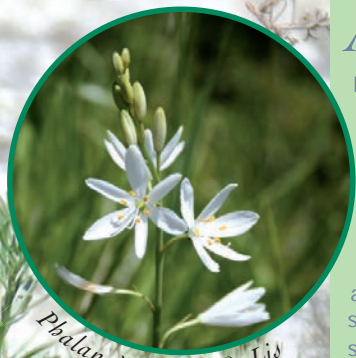
Phalangère à fleur de Lis