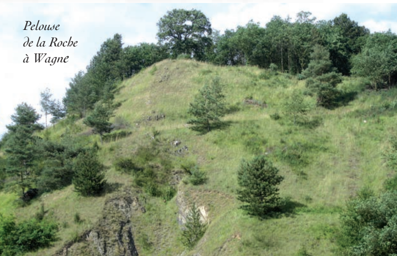
Pelouse de la Roche à Wagne

La Pointe de Givet est connue depuis le XIX ème siècle pour son intérêt botanique et géologique. Au milieu des années 1980, elle est répertoriée à l'inventaire des Zones Naturelles d'Intérêt Ecologique Faunistique et Floristique (ZNIEFF). En 1990, une association locale demande le classement en réserve naturelle des zones les plus intéressantes. La réserve est enfin créée en 1999 et confiée en gestion à l'Office National des Forêts et au Conservatoire du patrimoine naturel de Champagne-Ardenne.